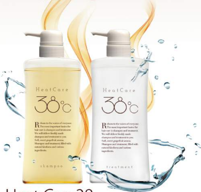
Heat Care 38 シャンプー トリートメント